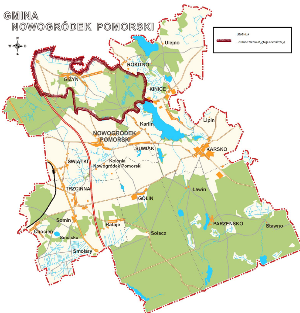
Schemat nr 21 Obszar rewitalizacji na terenie Gminy Nowogródek Pomorski.

Ostatecznie po przeanalizowaniu wszystkich danych i czynników dodatkowych wyznaczonym obszarem rewitalizacji na terenie Gminy Nowogródek Pomorski jest obszar pokrywający się z granicami sołectwa Giżyn . Powierzchnia ta wynosi ok 1.413 ha, co stanowi 9,68% w stosunku do powierzchni całej Gminy o łącznej powierzchni 14.592 ha. Liczba zamieszkująca ten obszar zgodnie z ogólną diagnozą Gminy wynosi 416 mieszkańców, co daje 12,33% populacji dla całej Gminy. Dokładny obszar poddany rewitalizacji obrazuje poniższy schemat i zaznaczony został kolorem pomarańczowym.